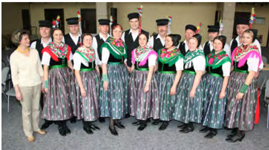
Serbska rejwanska skupina Ćisk/ Sorbische Volkstanzgruppe Zeißig e.V.