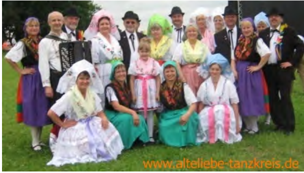
Ludowa rejewanska kupka "Stara lubość" z.t./ Volkstanzkreis "Alte Liebe" e.V.