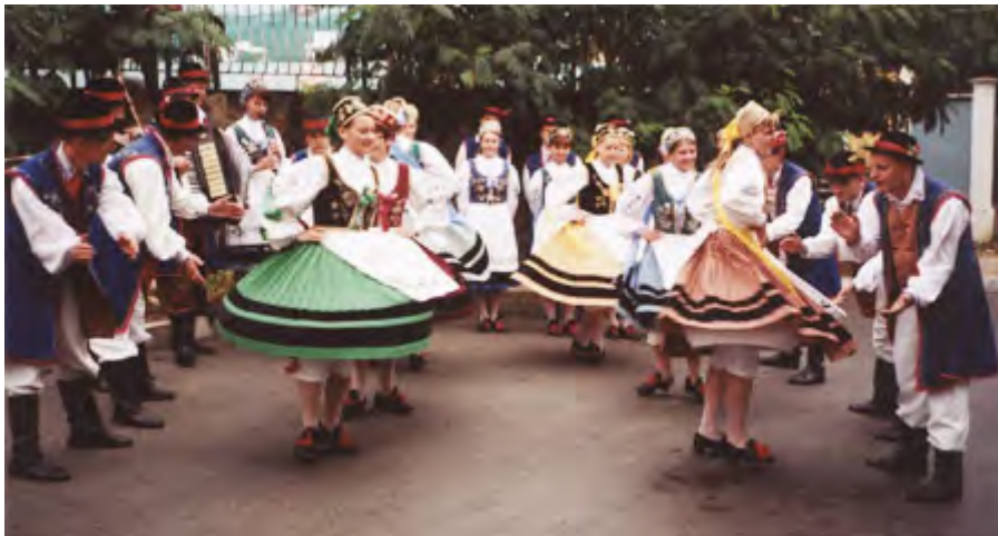
Regionalny Zespół Pieśni i Tańca "KASZUBY" POLAND / POLEN