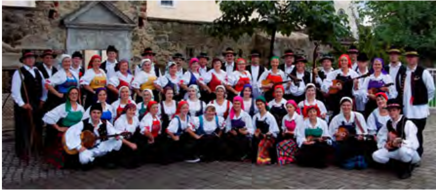
Kroatische Folkloregruppe des Burgenlandes POLJANCI AUSTRIA / ÖSTERREICH