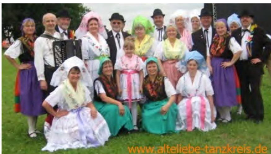
Rejowanska skupina "Stara lubość" z.t./ Volkstanzkreis "Alte Liebe" e.V.