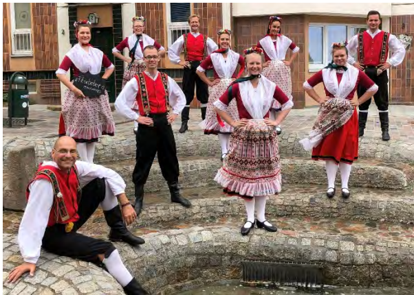
Tanzgruppe Fitschebeen e.V. NĚMSKA | DEUSCHLAND | GERMANY

... a dalši wuhotowarjo programow z Łužicy ... und folgende weitere Gruppen aus der Lausitz ...and following groups from Lusatia: