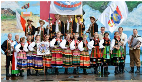
Zespół Pieśni I Tańca Ziemi Bolesławieckiej PÓLSKA | POLEN | POLAND