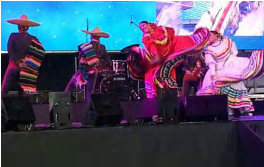
Grupo de Danzas Autóctonas y Tradicionales del Estado de QUERETARO Mexico, Orquesta Tipica del Estado de Queretaro MEXICO | MEXIKO