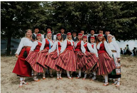
HEBE Estland/ Estonia