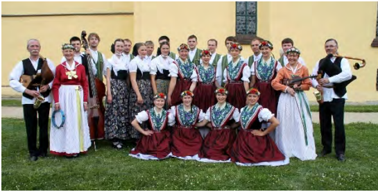
Serbska rejewanska skupina Smjerdžaca z.t./ Sorbische Volkstanzgruppe Schmerlitz e.V. Deutschland/ Germany