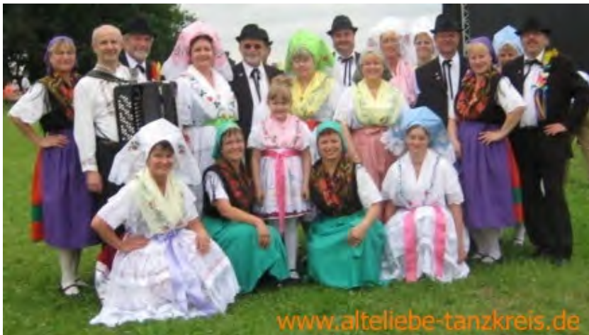
Ludowa rejoyanska kupka "Stara lubość" z.t./ Volkstanzkreis "Alte Liebe" e.V.