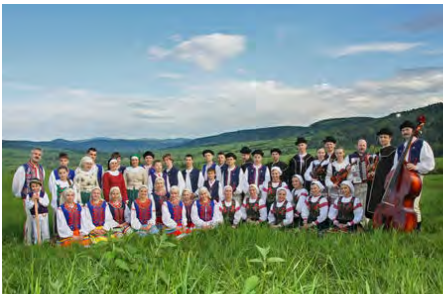
The Lemko Folk, Song and Dance Group „Kyczera“ POLAND | POLEN