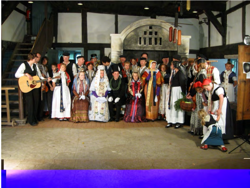
„De Öwerpetters“ GERMANY | DEUTSCHLAND