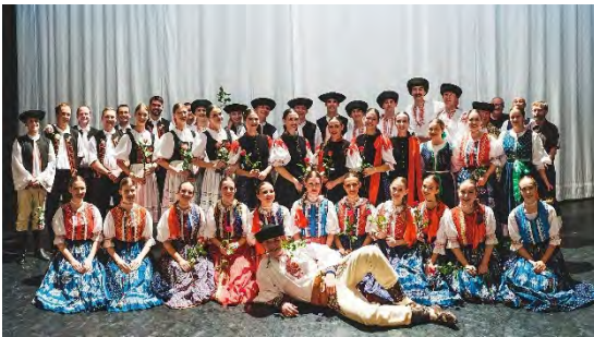
Folklórny súbor GYMNIK Slowakei/ Slovakia