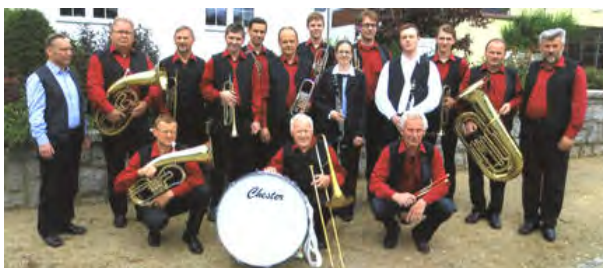
Dujerska kapala "Chróšćanscy muzikanća" / Blaskapelle "Croswitzer Musikanten "