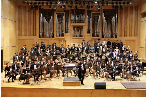
Młodzieżowa Orkiestra Dęta Leśnica PÓLSKA | POLEN | POLAND