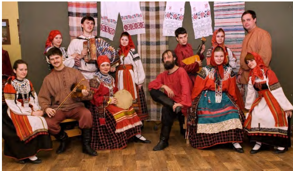
Ансамбль "Забава"/ Folk group ZABAVA RUSKA | RUSSLAND | RUSSIA | Россия