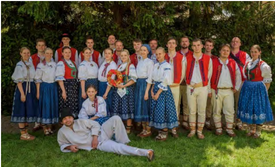
Taneční skupina "Jasénka" Tschechien/ Czech republic