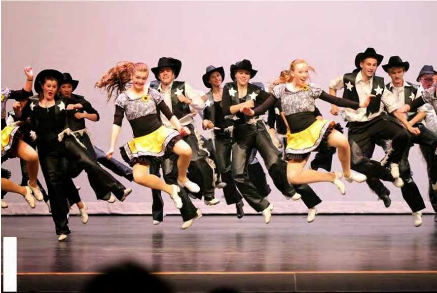
American Rhythm Folk Ensemble USA