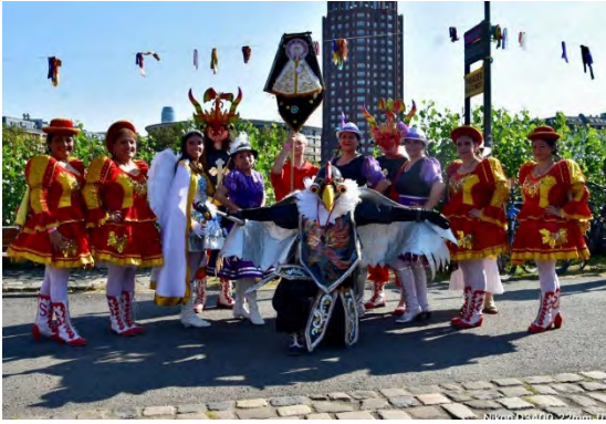
Pehuén e.V. Chilenisches Ensemble aus Frankfurt am Main) Deutschland/ Germany