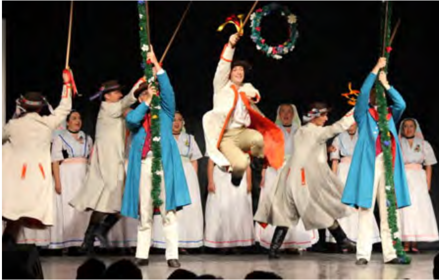
Serbski ludowy ansambl Budyšin Sorbisches National-Ensemble Bautzen