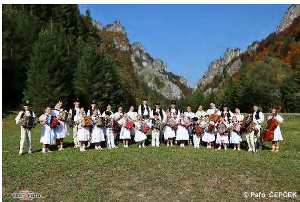
Bobáňovci – terchovský orchester ľudových nástrojov SĽOWAKSKA | SLOWAKEI | SLOVAKIA | SLOWENSKO