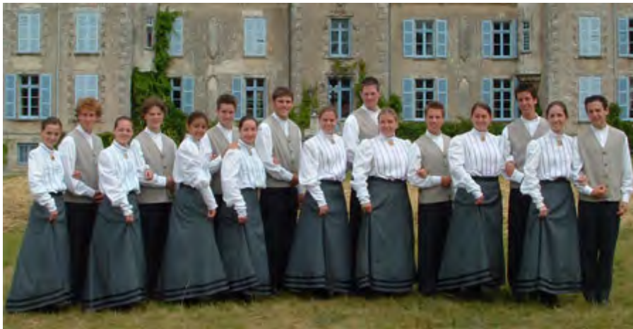
Les Mutins de Longueuil CANADA / KANADA