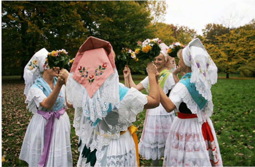
Nimsko-serbski ansambel Chóšebuz Deutsch-Sorbisches Ensemble Cottbus