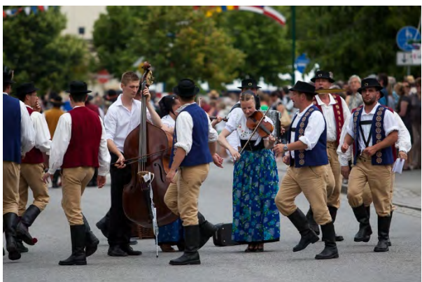
Muska spěwna skupina "Přezpólni" Herrengesangsgruppe "Přezpólni"