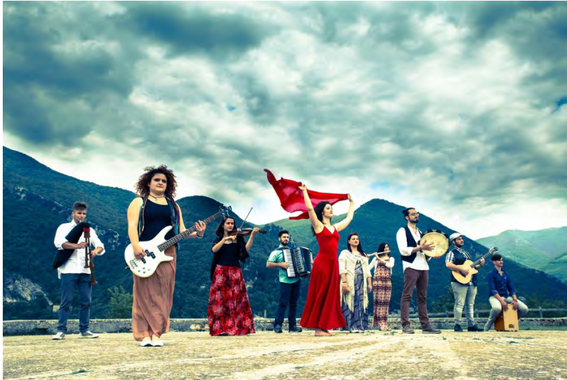
I Trillanti ITALY | ITALIEN