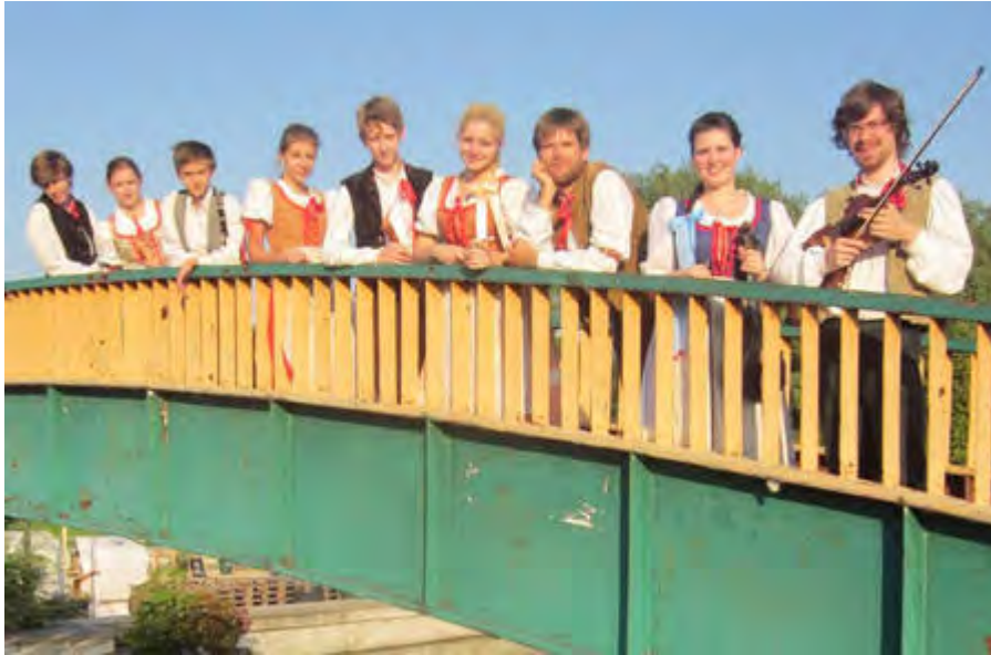
Lidová muzika z Chrástu CZECH REPUBLIC | TSCHECHIEN