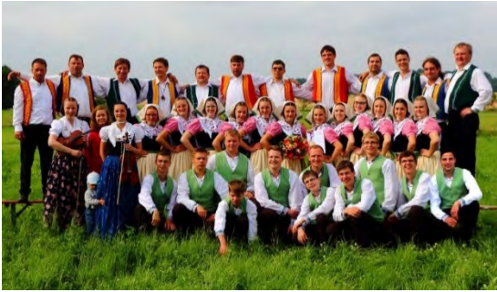
Serbski folklorny ansambl Wudwor z.t./ Sorbisches Folkloreensemble Höflein e.V. Deutschland/ Germany