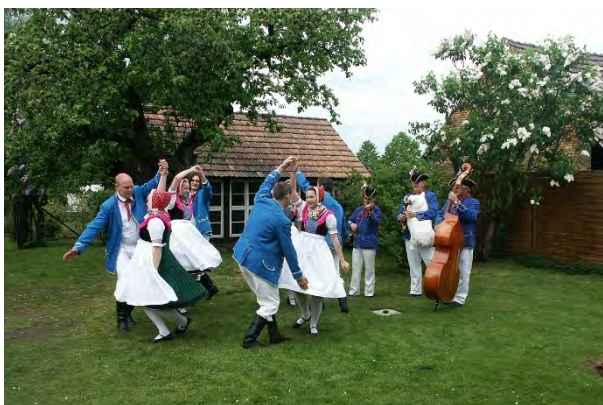
Serbski folklorny ansambl Slepó/ Sorbisches Folkloreensemble Schleife