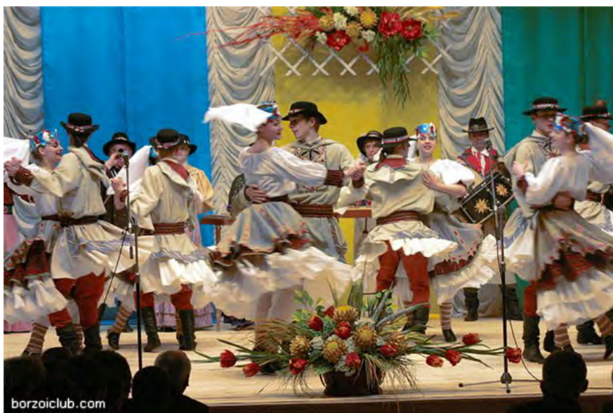
Krupitskiya Muzyki/Крупіцкіе музыкі BELARUS