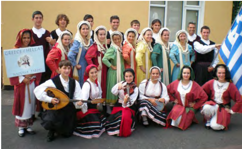
Music & Dance Group "NAOUSSA PAROS" GREECE | GRIECHENLAND