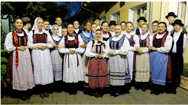
Harruckern Táncgyüttes/Folkdance Group MADŹARSKA | UNGARN | HUNGARY | Magyarország