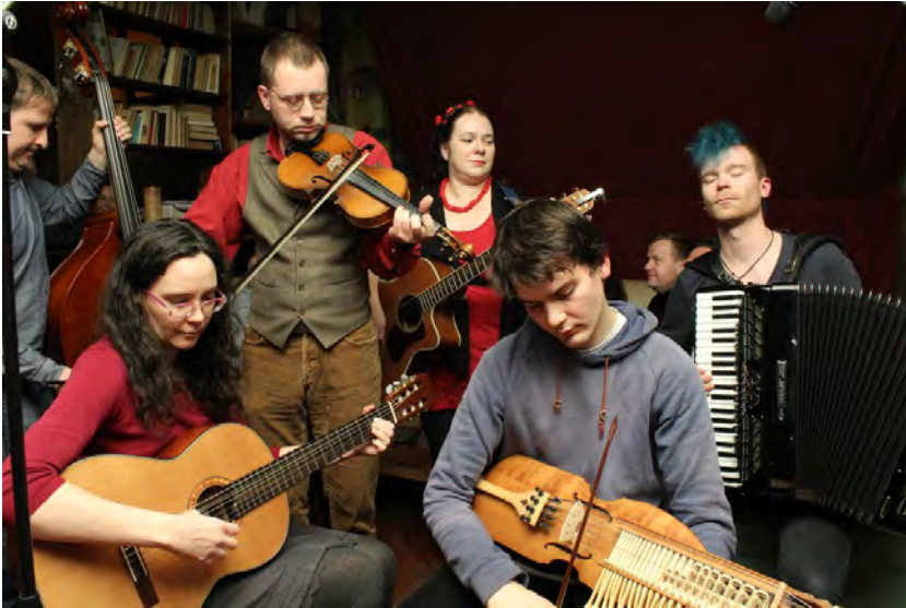
Serbska reja (Lipsk/Leipzig/ Germany)

... und die Initiatoren / and the initiators