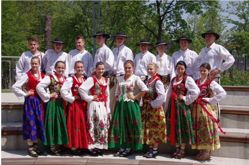
Zespół Góralski ZORNICA POLAND | POLEN