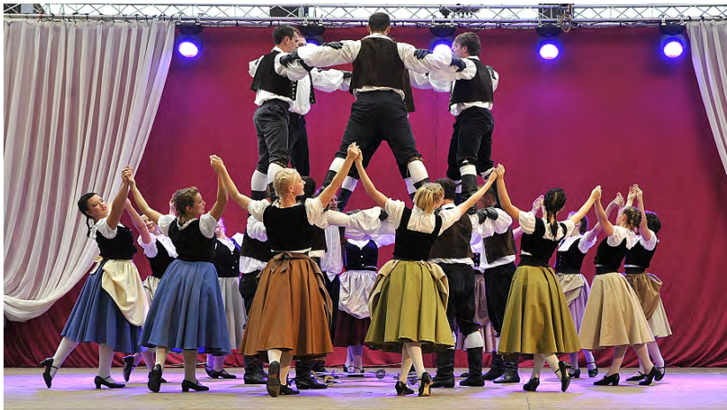
Thüringer Folklore Tanzensemble Rudolstadt e.V. GERMANY | DEUTSCHLAND