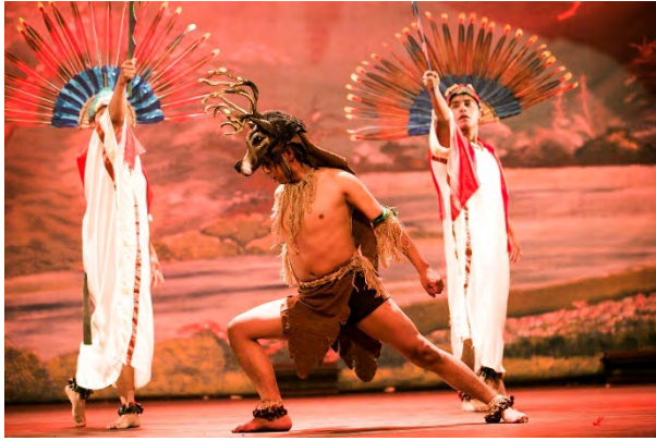
Ballet Folkórico de La Paz – BAFOPAZ BOLIWIKA | BOLIVIEN | BOLIVIA