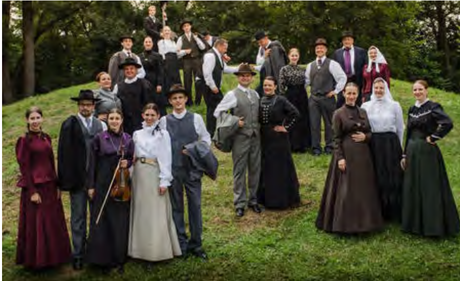
Folklorna skupina DRAGATUŠ SLOVENIA | SLOWENIEN