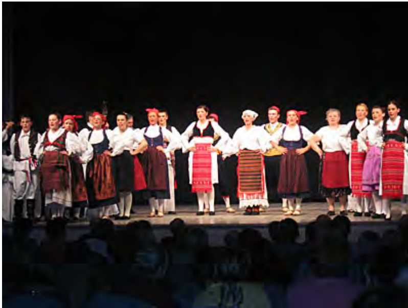
The Aromanians Iholu & Piliesterlu ROMANIA