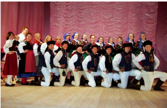
Tanz- und Folklorensemble Ihna Erlangen* Deutschland/ Germany