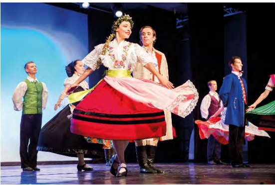
Serbski ludowy ansambl/ Sorbisches National- Ensemble Deutschland/ Germany