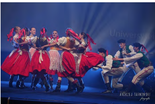
Zespół Pieśni i Tańca "ŁANY" Polen/ Poland