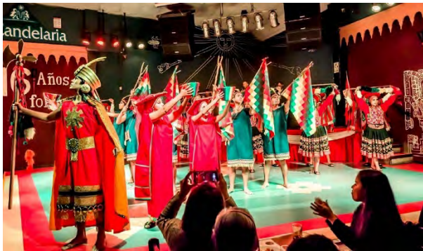
ASOCIACIÓN CULTURAL QHASWA PERÚ PERU