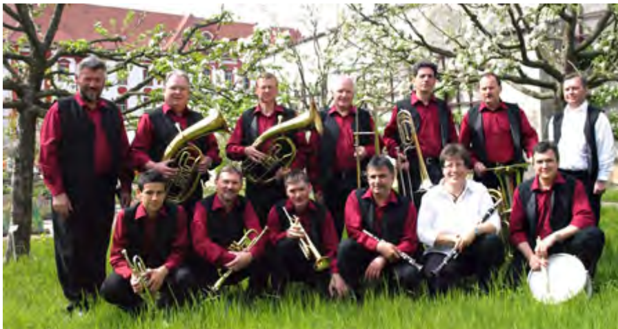
Dujerska kapala "Chrósčanscy muzikanća" / Blaskapelle "Crostwitzer Musikanten "

Program dorosta 13.7.2013, 16.00 hodž. na Krawčikec dworje/ Programm der Nachwuchskünstler am 13.7.2013, 16.00 Uhr in Crostwitz: