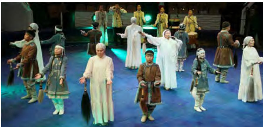
Folklore ensemble AYARIK YAKUTIA / JAKUTIEN