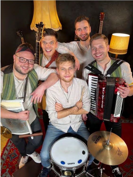
Die Popsorben [Ł]