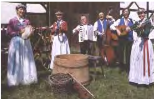
■ Němsko-serbski ansambl Žyłow Deutsch-sorbisches Ensemble Sielow