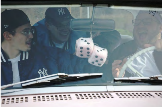
Nowa Doba [Ł]