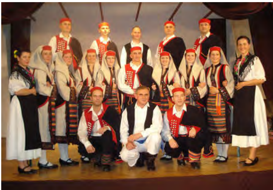
HKD Čakavci & Tamburaški Sastav Židanci HUNGARY | UNGARN