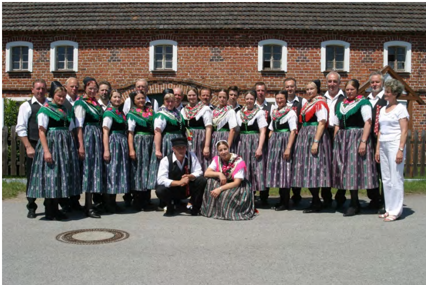
Serbska rejomanska skupina Ćisk z.t. Sorbische Volkstanzgruppe Zeißig e.V.