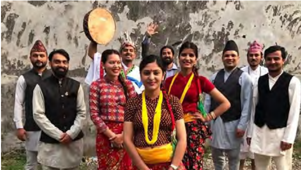
Youth Creation Theater Pokhara, Nepal and M.N.desire.inc.Pvt.Ltd Kathmandu, Nepal