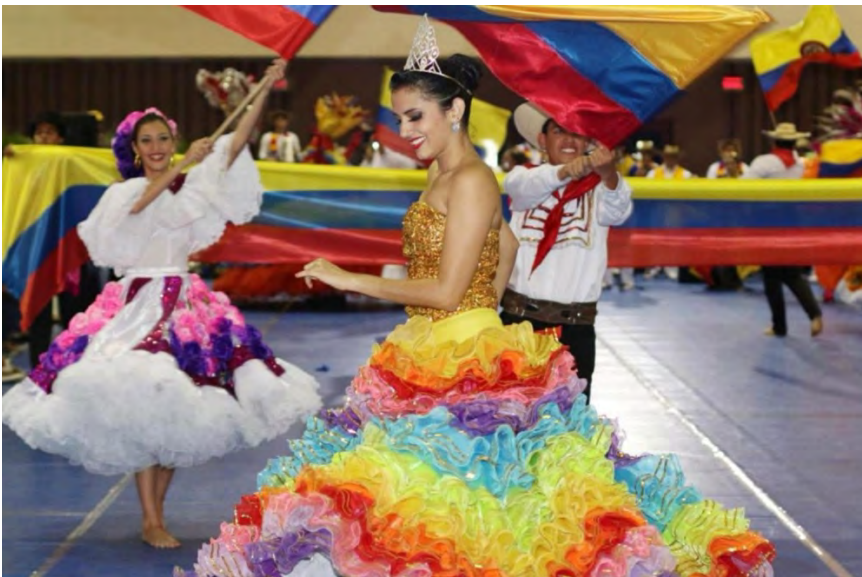
Grupo Folclórico Uninorte COLOMBIA | KOLUMBIEN