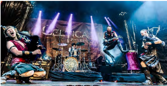
Celtica Pipes Rock (A)