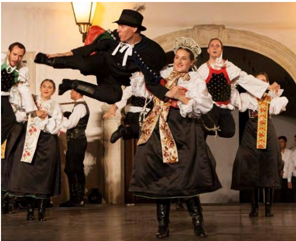
Folklorni ansambl gradišćanskih Hrvatov/ Folkloreensemble d. Burgenländischen Kroaten KOLO SLAVUJ AWSTRISKA | ÖSTERREICH | AUSTRIA