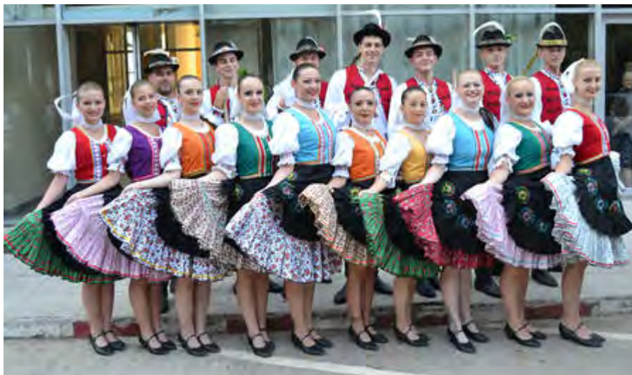
Folklore Ensemble BYSTRANČAN SLOVAKIA | SLOWAKEI