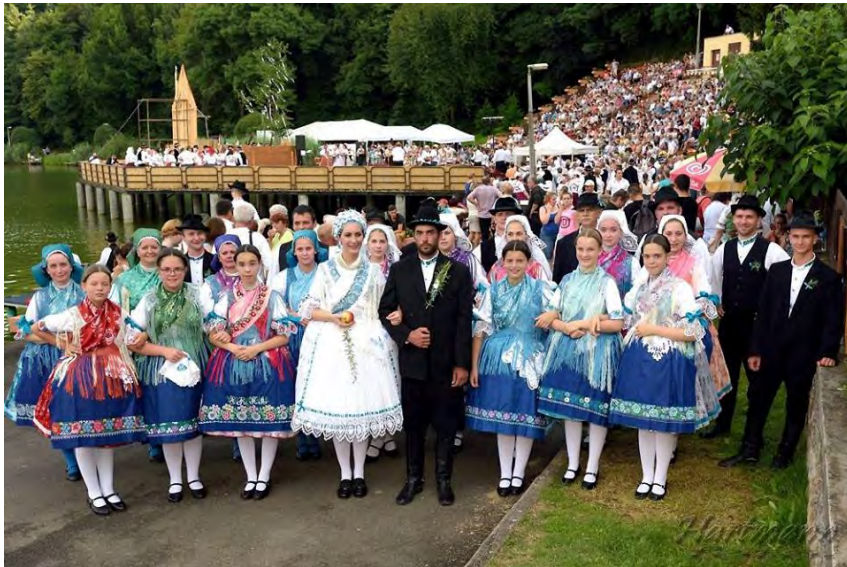
Furmicska Néptánc Egyesület / Furmička Volkstanzverein HUNGARY | UNGARN