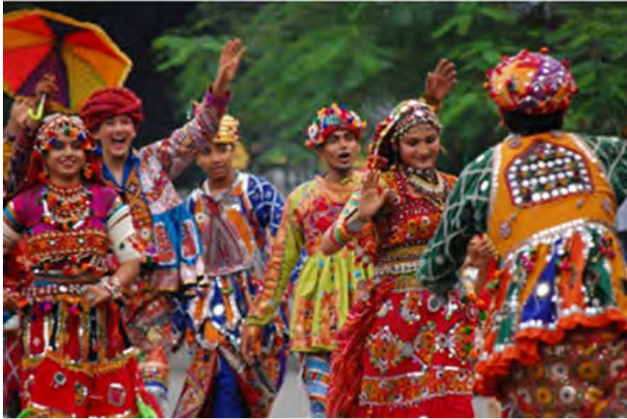
Gujarat Art Academy INDIA | INDIEN