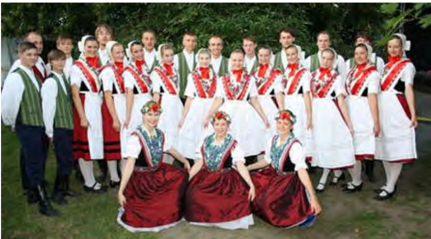
Die Sorbische Tanzgruppe Schmerlitz

Up you experience each case on the stage also this time again those native culture groups, which brought the festival 1995 into being: