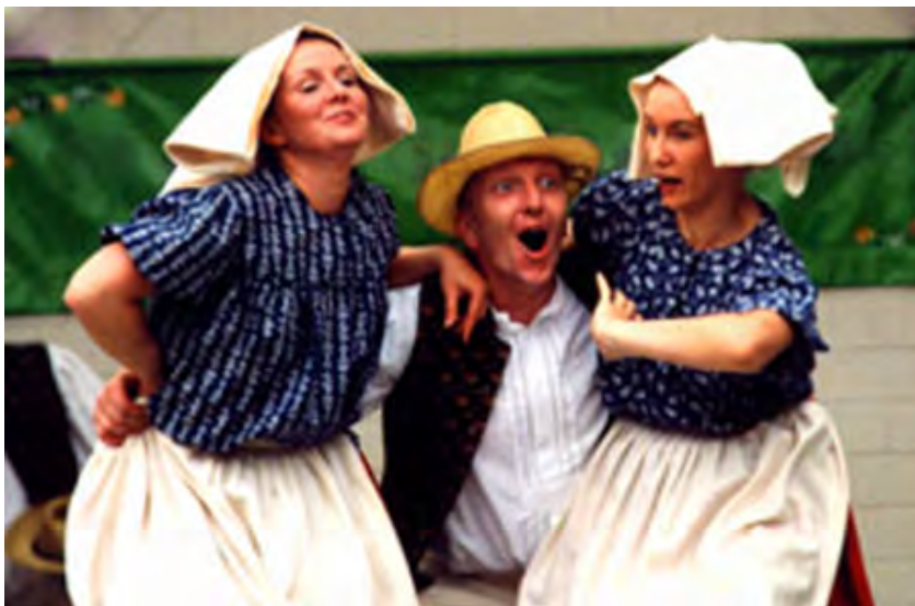
Rejoyanski ansambl Pśijašelstwo Tanzensemble Freundschaft