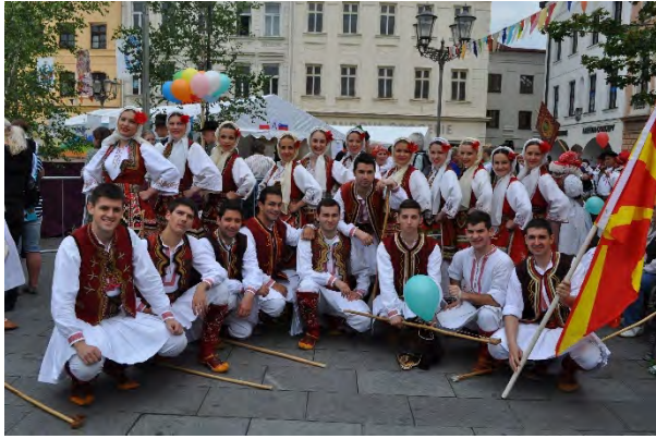
Ansambli za narodni ora i pesni pri AKUD "MIRCE ACEV"/ Folklore ensemble at the AKUD "MIRCE ACEV"