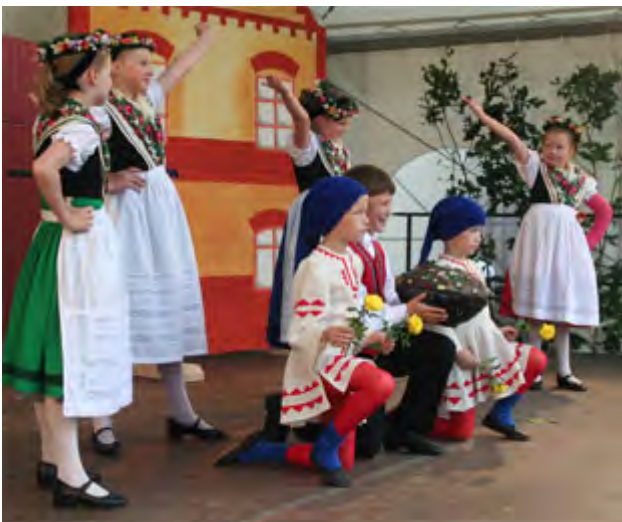
... sobotu wječor /and Saturday evening: Chróścicy-special: