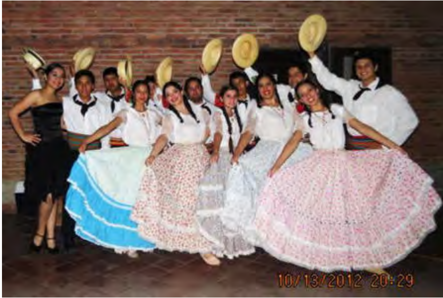
Grupo de Danza minguero JEROKY PARAGUAY