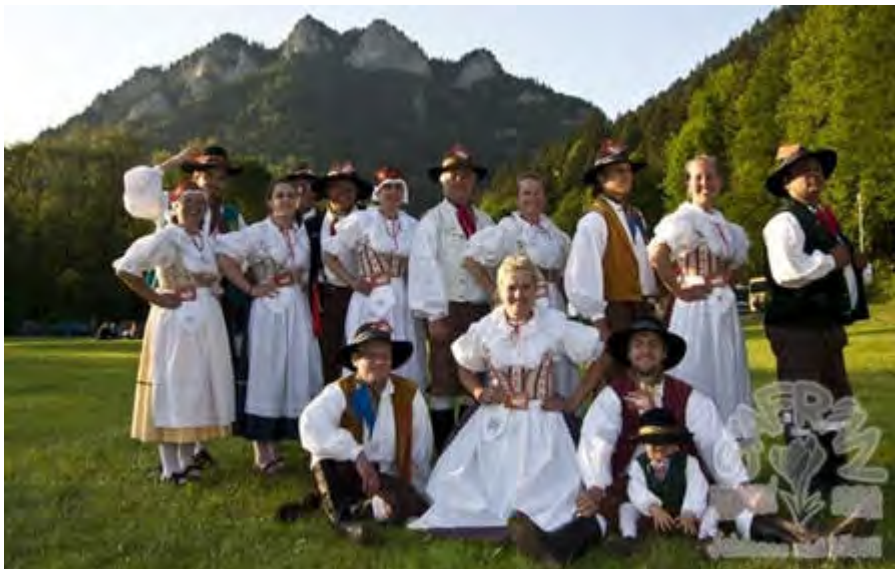
Folklorní soubor ŠAFRÁN z Jablonce nad Nisou CZECH REPUBLIC | TSCHECHIEN