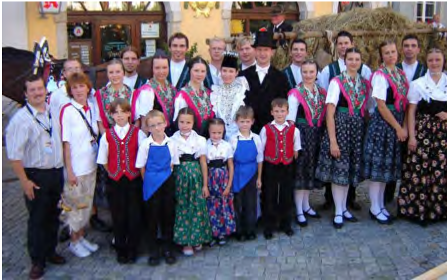
Das Sorbische Folkloreensemble WUDWOR