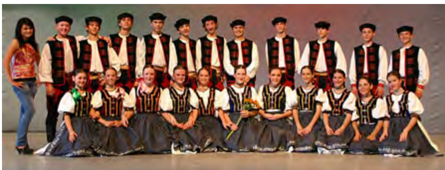
Folklore Ensemble JUROŠIK SLOVAKIA / SLOWAKEI