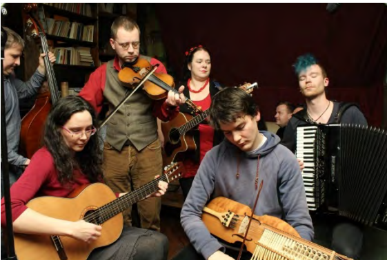
Serbska reja [Ł]