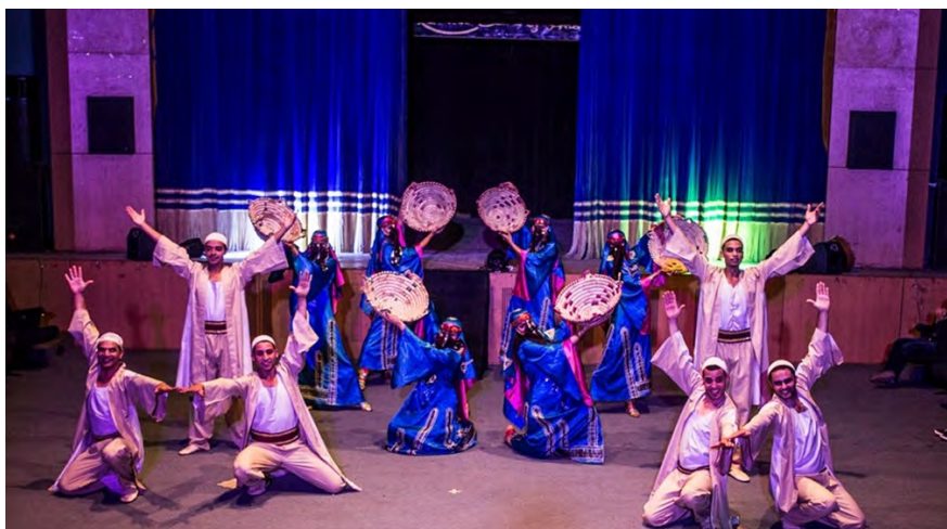
Art Appreciation folk dance group EGYPT | ÄGYPTEN