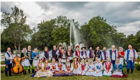
Zespół Pieśni i Tańca "LEGNICA" Polen/ Poland