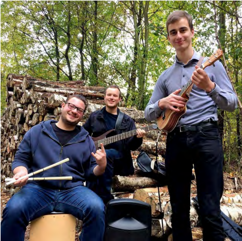
Sorbian Art Trio (Lusatia/Germany)