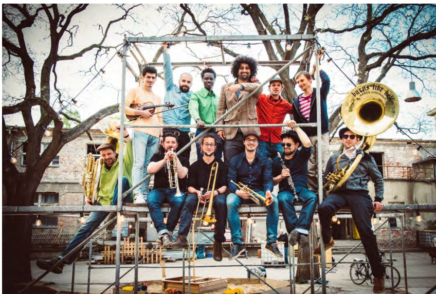
Banda Internationale (Germany)

24.6.2017, gg. 23:00 "Chróšćan specialita - Crostwitz-Special"