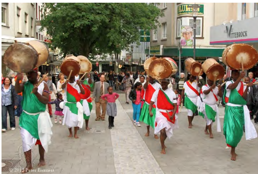
Batimbo Traditonal Magic (Burundi)