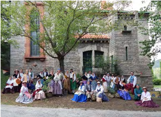
S'Eixam Mallorqui Spanien/ Spain