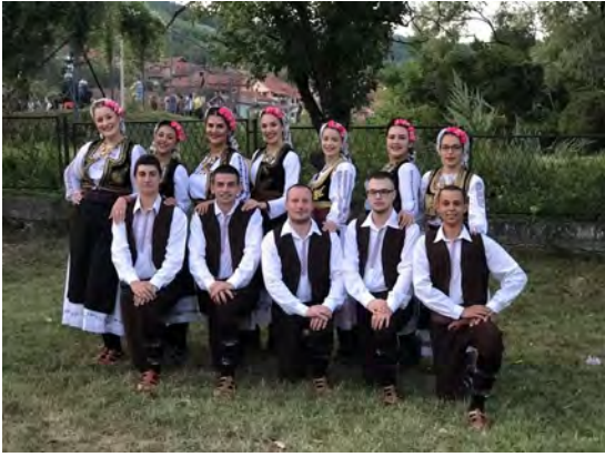
Kulturno- umetničko društvo "Anđeli" Serbien/ Serbia