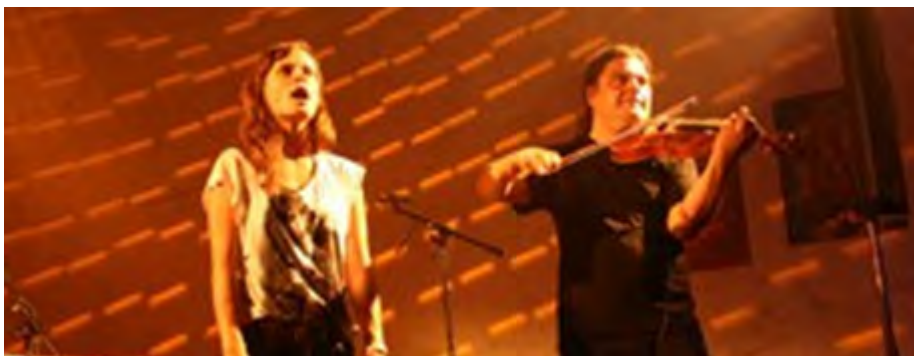
Berlinska dróha (D)