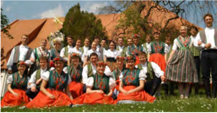
■ Das Sorbische Dorfensemble Höflein The Sorbian village ensemble Höflein Internet: www.wudwor.de