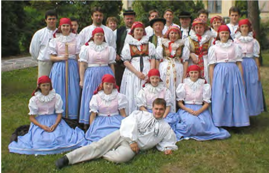
Hanácký národopisný soubor Olešnica Doloplazy CZECH REPUBLIK / TSCHECHIEN