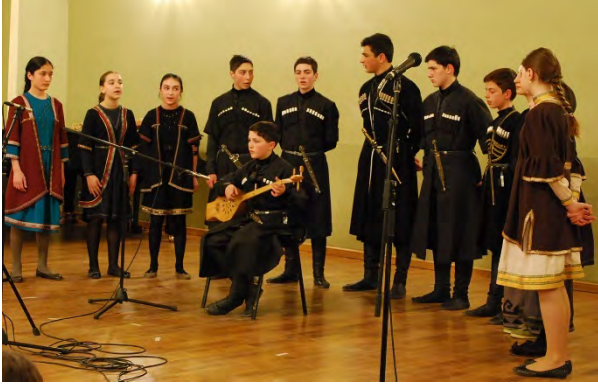
Singing and Chanting Folklore Group „Pherkhisa” GEORGISKA | GEORGIEN | GEORGIA | საქართველო