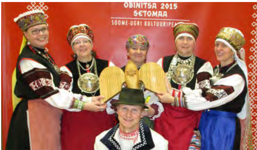
Mooste folk musicians and Madara' ESTONIA | ESTLAND