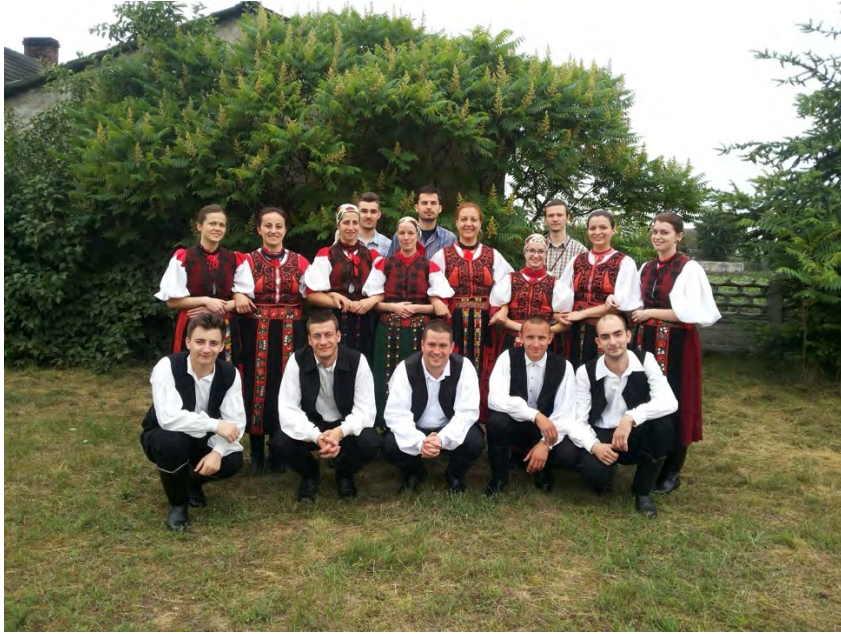
Szarkaláb Hungarian Folk-Dance Group ROMANIA | RUMÄNIEN