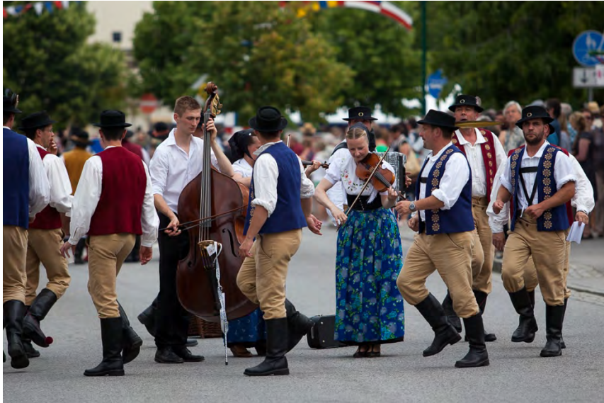
Muska spěvna skupina "Přezpólni" Herrengesangsgruppe "Přezpólni"