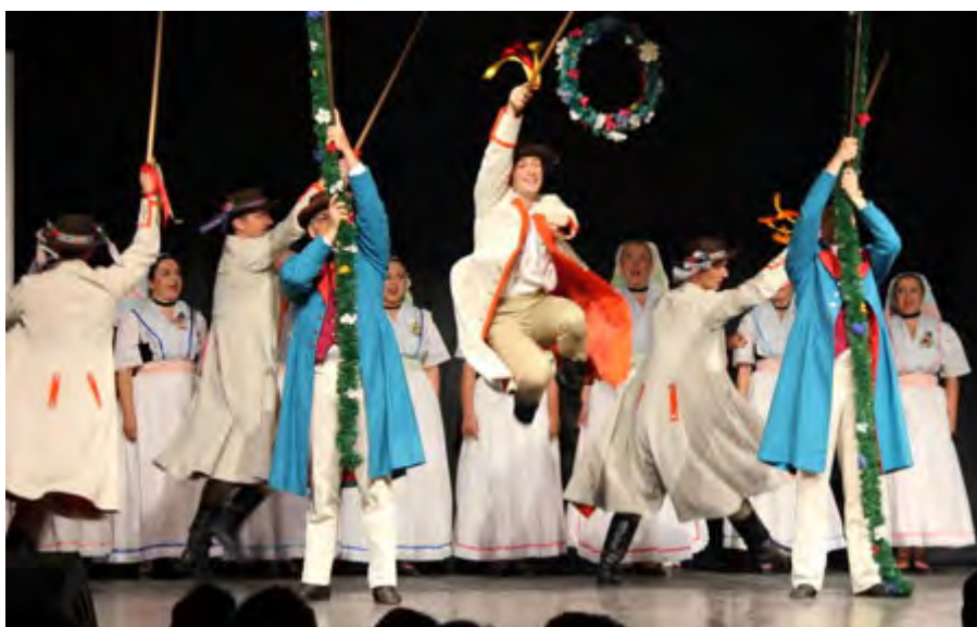
Serbski ludowy ansambl Budyšin Sorbisches National-Ensemble Bautzen