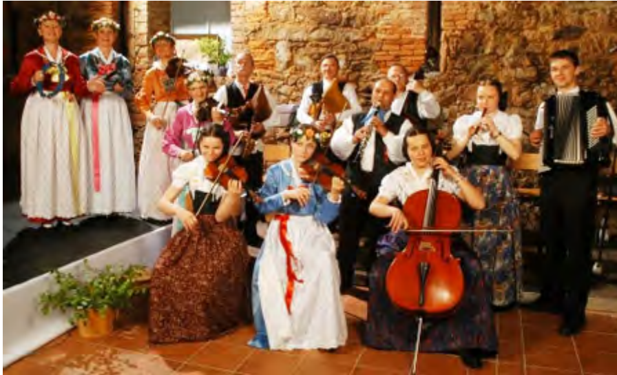
Serbska folklorna skupina/ Sorbische Folkloregruppe "SPRJEWJAN"