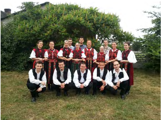
Hungarian Folk- Dance Group "Szarkaláb" Rumänien/ Romania