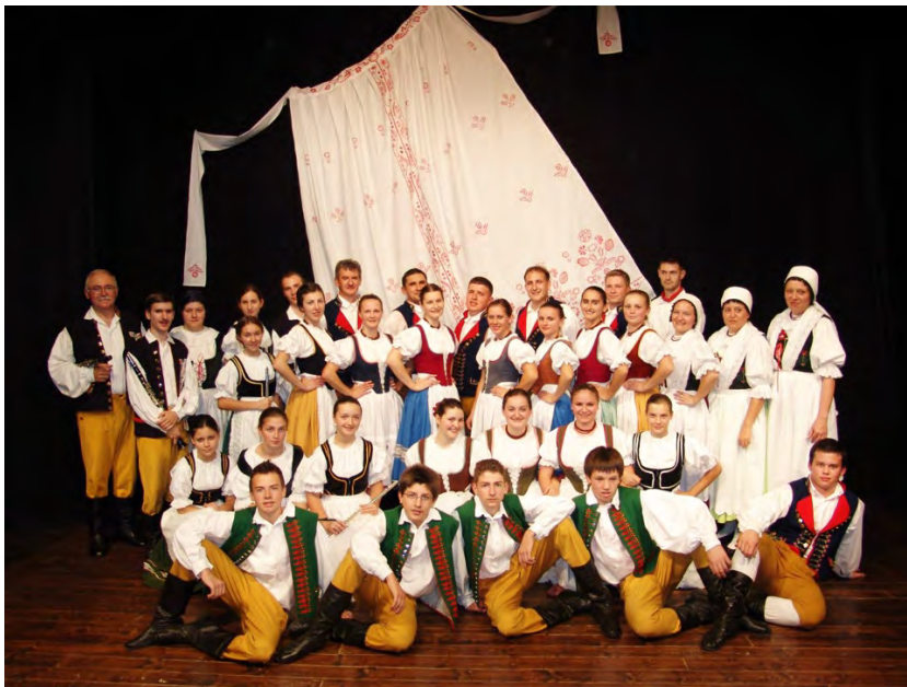
Tanečni soubor HOLUBIČKA CROATIA | KROATIEN