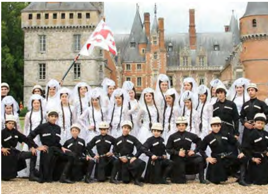
Folk Dance Ensemble SIKHARULI GEORGIA | GEORGIEN