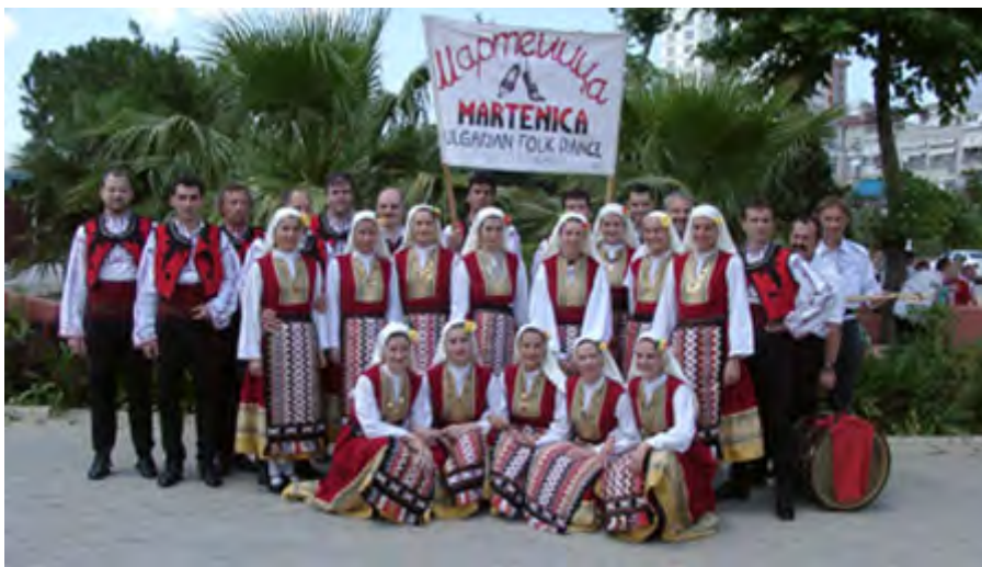
"MARTENICA" HUNGARY / UNGARN