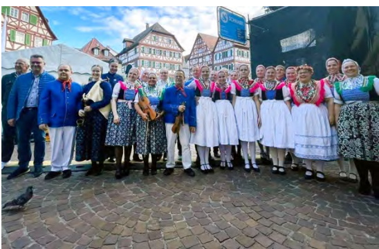
Serbski folklorny ansambl Slepo/ Sorbisches Folklorensemble Schleife Deutschland/ Germany