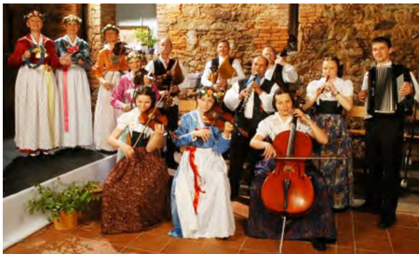
Serbska folklorna skupina/ Sorbische Folkloregruppe "SPRJEWJAN"

... a dalši wuhotowarjo programow z Łužicy ... und folgende weitere Gruppen aus der Lausitz ...and following groups from Lusatia: