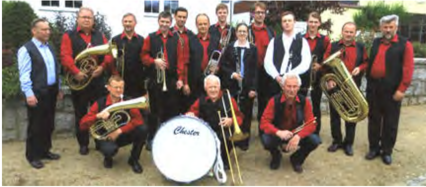
Dujerska kapala "Chrósčanscy muzikanća" / Blaskapelle "Croswitzer Musikanten "

Program dorosta 11.7.2015, 15.30 hodž. na Krawčikec dworje/ Programm der Nachwuchskünstler am 11.7.2015, 15.30 Uhr in Croswitz: