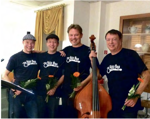
Kula Bula (Łužica/GERMANY)