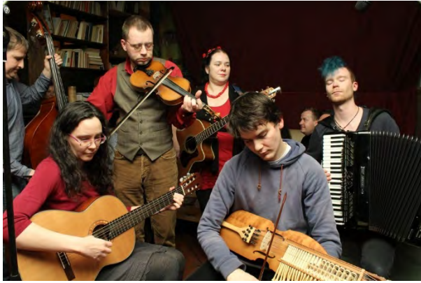
Serbska reja Lipsk/Leipzig