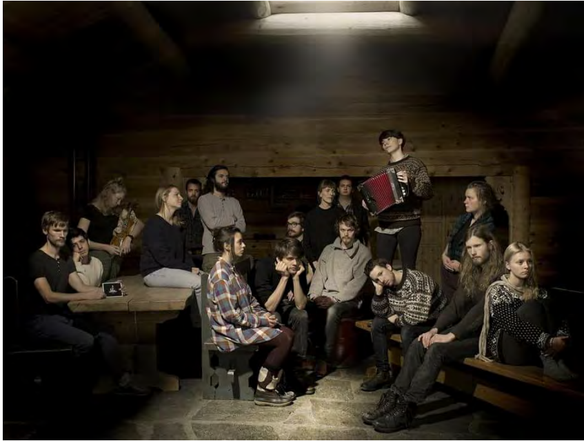
Myllargutens Gammaldansorkester NORWAY | NORWEGEN