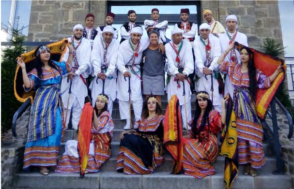
Association Culturelle “Couleurs D’Algerie” ALGERISKA | ALGERIEN | ALGERIA | الجزائر