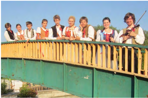
Lidová muzika z Chrástu ČESKA REPUBLIKA | TSCHECHISCHE REPUBLIK | CZECH REPUBLIC