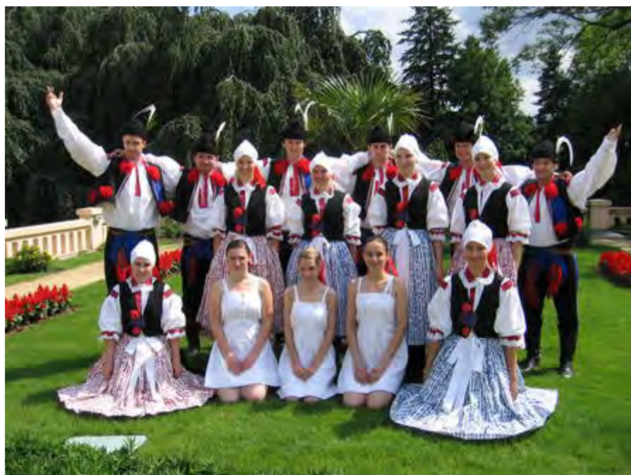
Folklorní soubor písní a tanců Občanské sdružení HANDRLÁK CZECH REPUBLIC | TSCHECHISCHE REPUBLIK