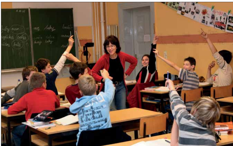
Wučba serbsčiny na Dolnosorbiskem gymnaziumje./ Sprachunterricht am Niedersorbischen Gymnasium Cottbus.

Wot třećeho tydženja januara prezentuje so hornjoserbski džěcacy časopis „Płomjo“ w interneće w nowym wuhotowanju (pod www.plomjo.de ). Wosom rubrikow wabja šulerjow, so tež přez tutón moderny medij z Płomjenjom zaběrać. Tak móža so wobhonić wo nastaću a wo stawiznach časopisa, čitać wšelake zajimawe přinoški a žorty abo tež podate rysowanki wumolować. Pod rubriku „Čiń sobu!“ móža so šulerjo-