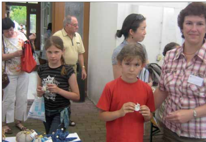
Prědny zeń wótwórnjonych žuri w Serbskem domje w Chóšebuzu./Tag der offenen Tür 2008 im Wendischen Haus.

Domowinska župa Dolna Łužyca z.t. ma we chyli 37 Domowinskich kupkow z 1057 cłonkami a 18 towaristwow z 1985 cłonkami. Naše cłonki su kšuty słup našeje župy. Župne pśedsedarstwo a sobuzěłašerje zastojnstwa Domowiny žarže stawny kontakt k pśedsedarstwam kupkow a towaristwow. W decentralnych wobradowanjach se wuměnjaju nazgónjenja a se pšemyšlujou wo móžnosćach, kak by mogli serbsku rěc a kulturu stawnje zapšěgnuć do akcijow a projektow. Pšikładne narodne žěto mamy tam, žož su gmejnske zastupniki rownocasnje teke cłonki Domowiny. Pómjeniš mogu se take komuny ako Hochoza, Drjenow, Barbuk, Janšojce, Dešno abo Brjazyna. K 12. razoju smy pšewjadli zmakanje našych cłonkojskich towaristwow. Witali by, gaby zastupniki Domowinskich kupkow a towaristwow se tam a zas na wobradowanjach župnego pśedsedarstwa wobžělili. Pšecej dalej musymy pytaš za gózbami, našu dolnoserbšku rěc do srjejžišća našogo statkowanja stajiš. Pšez wobželenje na rěcnych kursach a zapšěgnjenje pśednoskow wo rěcy a kulturje Serbow mogu se znajobnosći rozšyrić. Wšake kupki wužywaju južo aktiwnje pórucenja Šule za dolnoserbšku rěc a kulturu. Towaristwa w župje su wjelgin wšakorake a maju wšake zaměry. Wšykne pak maju zgromadnu slězynu: woplěwanje serbskich tradicijow, nałogow, rejoy, spiwow, pśěrdnjenje serbskich stawiznow, serbskeje rěcy a z tym zdžaržanje