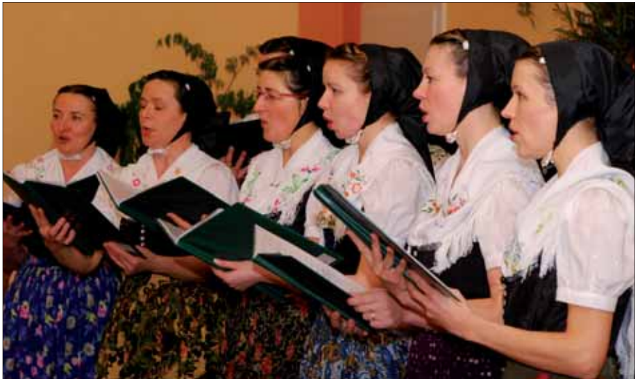
Chór Bratrowstwa na lětnym swjedženju swójeho towarstwa 2008 w Sulšecach.