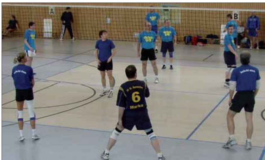
Dnja 28. februara wotmě so w Budyšinje 27. wolejbulowy turněr Serbskeho Sokoła wo pokal Domowiny. Dobyćerjo běchu pólsacy přećeljo z Tokarnje.