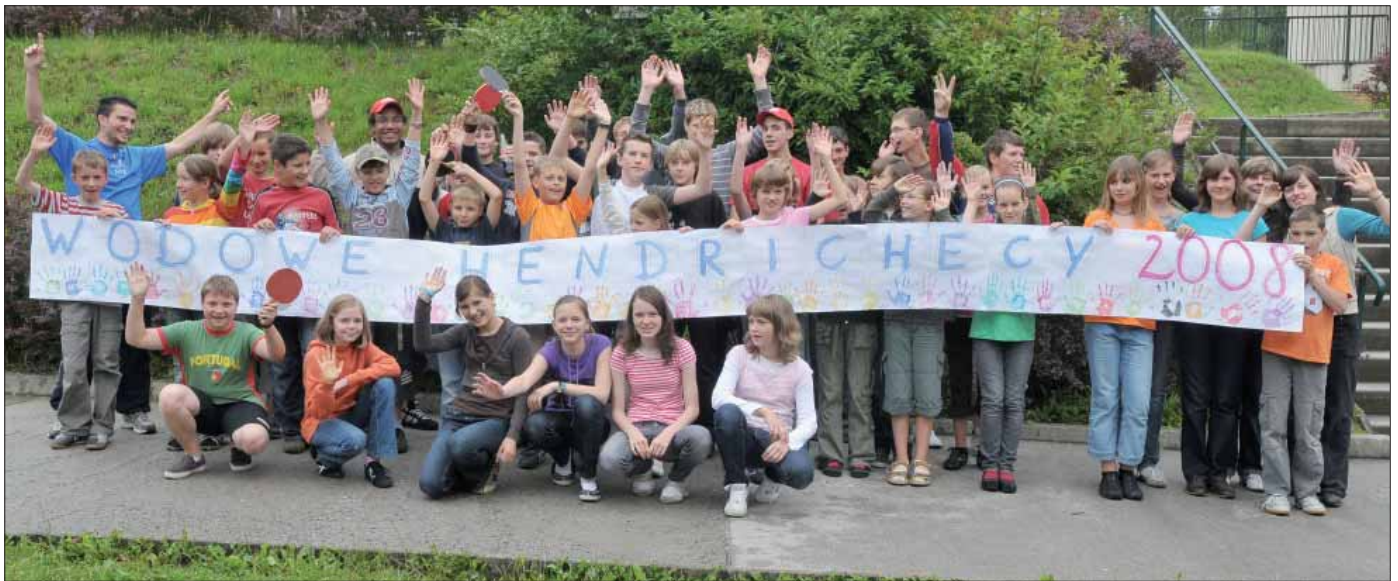
Kóždy lěto organizuje Serbske šulske towarstwo prózdnišne rěčne lěhwo. Loni wotmě so wone we Wodowych Hendrichcach./ Der Sorbische Schulverein organisiert jedes Jahr ein Sprachferienlager. 2008 fand es in Seiffhennersdorf statt.