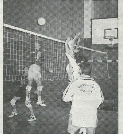
Scena z finalneje hry volleyballoweho turněra Sokoła wo pućowanski pokal Serbskich Nowin miez Worklecami a Serbskim gymnazijom.