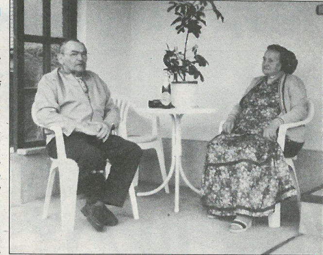
... a dżensa ze swojej mandżelskej před domčkom w Ralbicach.

wjesny pachoł kupić. Tohodla hrajachu někotři bosy, pozokach abo w normalnych črijach. Někotři móžachu sej znajmjeńša sportowe črije ("cwički") w Čěskej wobstarać.