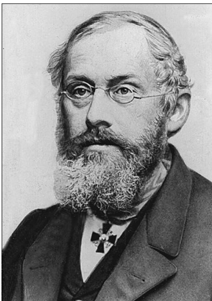
Jan Arnošt Smoler

Jan Arnošt Smoler narodži so 3. měrca 1816 jako syn wučerja we Łuču/Merzdorf; wjes je so 1978/79 wuhla dla zhubila. Wón wotrosće we Łazu, wopyta gymnazij w Budyšinje a studowaše teologiju a słowjansku filologiju