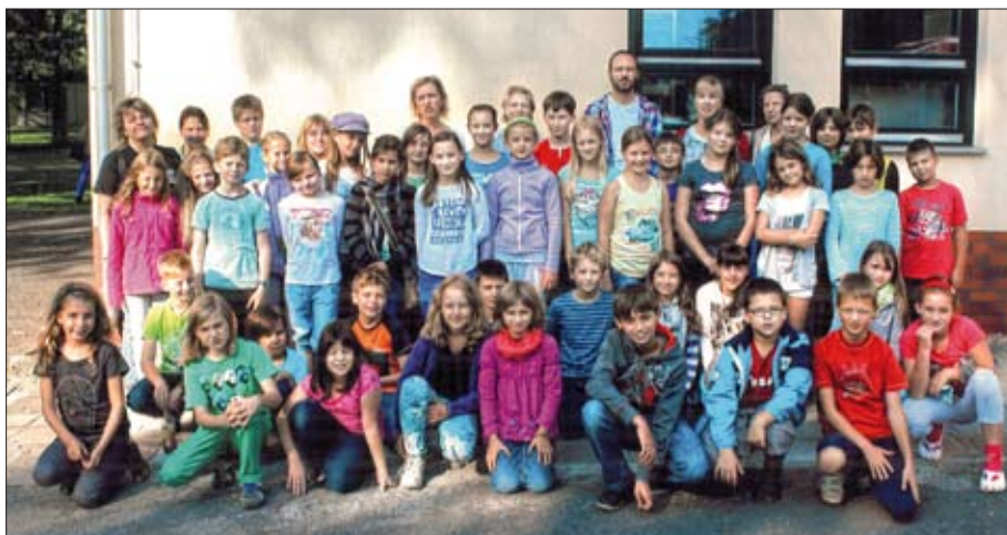
pŏeb (04.09.2013 - 06.09.2013)