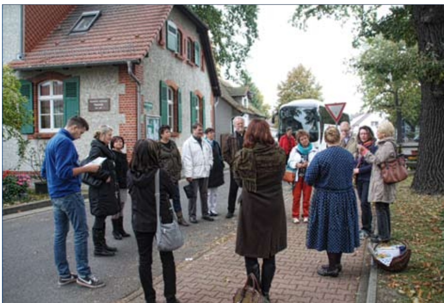
Člonjo Zwjazka za serbski kulturny turizm na lětušej ekskursiji w Ptačecach.