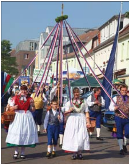
Grodskojski swajźbarski šěg

Jaden wót nich jo był nęgajšny moderator, kótayž jo ned pó starej wašni na jawišćo skócył, mikrofon pšimjeł a pśiduce reje pšipowězeł. Wjele