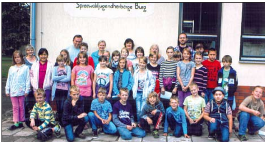
pŏeb (02.09.2013 - 04.09.2013)