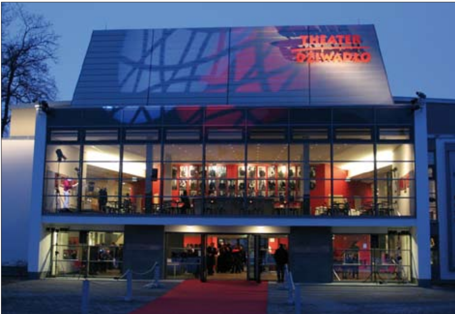
Hlowny dom Němsko-Serbskeho ludoweho dźiwadla w Budyšinje