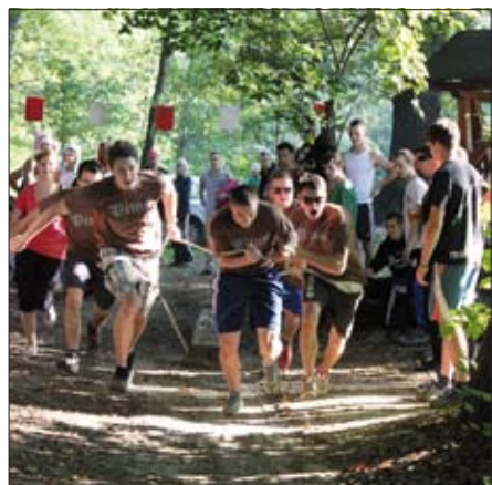
Na lětušim wubědžowanju „Powerserb“ dnja 14. požnjena w Radworju

Najsylniše serbske mustwo pytaše Pawk dnja 14. požnjena na Radworskej kupje. W kooperaciji z młodžinskim klubom wuhotowa tradicionalny projekt „Powerserb“. Dohromady šěsć mustwow ze serbskich wjeskow wubědžowaše so we wšelakich disciplinach. Na wobdźělnikow čakachu nowe discipliny, kaž naklumpanje hadžicy, čolnikowanje na wjesnym haće abo čahanje zdónkow. Lětuši dobyćer je