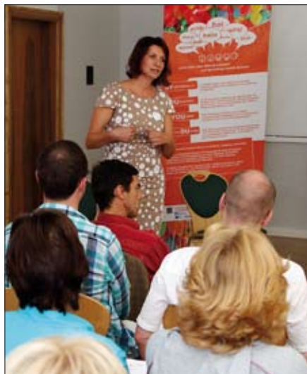
Na forumje wo rěčnym planowanju dnja 7. septembra w Budyšinje