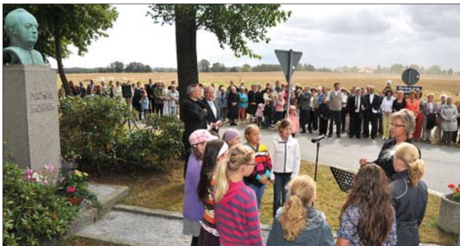
Zhromadnje spominašej Towarstwo Cyrila a Metoda a Maćica Serbska dnja 1. septembra, na dnju 180. posmjertnych narodnin Michała Hórnik, na tutoho katolskeho duchowneho, wědomostnika a spisowacela.

abo zběraja starožitnosće abo pohladnicy wsow: „Smy mjenjenja, zo toleranca z wobeju stron a wěda wo Serbach předsudkam zadžěwa.“ Na wjacorych přikładach wona rozjasni, zo tworitej w župje narodnosć a nabožnosć krutej stolpaj, kotrejž so njehodžitej džělić.