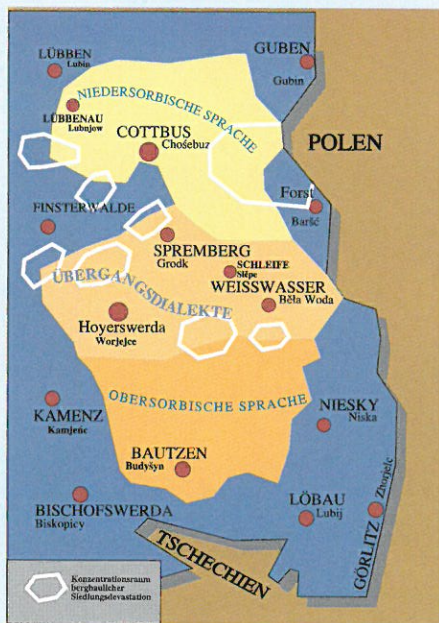
Sorbisches Sprachgebiet heute

ist seit 1000 Jahren ständig geschrumpft. Die wachsende Dominanz deutscher Sprache und Kultur in allen Lebensbereichen, häufig noch verstärkt durch Unterdrückung des Sorbischen/Wendischen in Kirche, Schule und Öffentlichkeit, führte zum Rückgang der sorbischen Sprache und Kultur. Die Heimat der Sorben ist die Oberlausitz im Freistaat Sachsen und die Niederlausitz im Land Brandenburg.