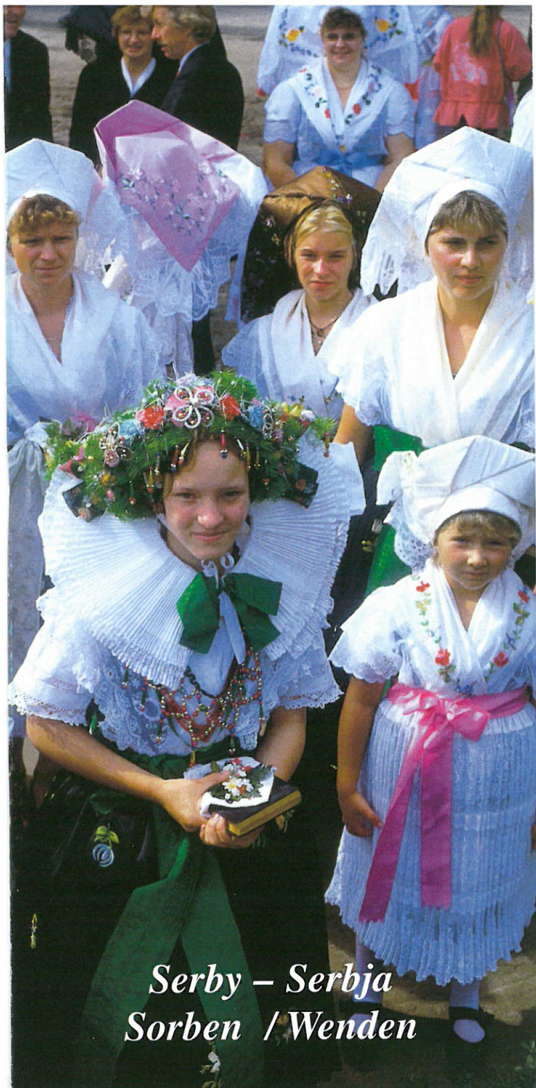
Serby – Serbja Sorben / Wenden