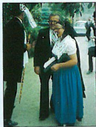
Tracht der katholischen Sorben