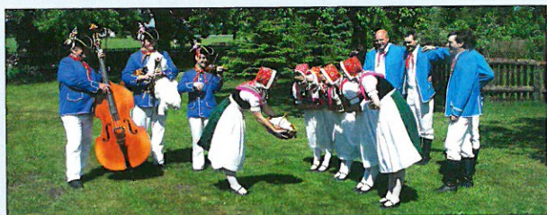
Sorbisches Folkloreensemble Schleife

in der sorbischen Lausitz ist eines der größten in Deutschland. Von den ehemals elf regionalen Formen sind heute noch vier