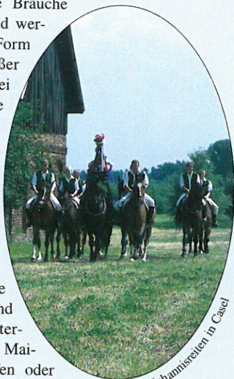
Johannistreiben in Casel

Weit verbreitet sind Winter- und Frühlingsbräuche wie die Vogelhochzeit und wendische Fastnacht. Osterfeuer und Hexenbrennen, Maibaumaufstellen und -werfen oder Erntebräuche wie das Hahnrupfen, Hahnschlagen, Stoppelreiten und Kranzstechen vervollständigen das Jahr. Zu diesen Anlässen tragen die jungen Mädchen oftmals ihre Festtracht.