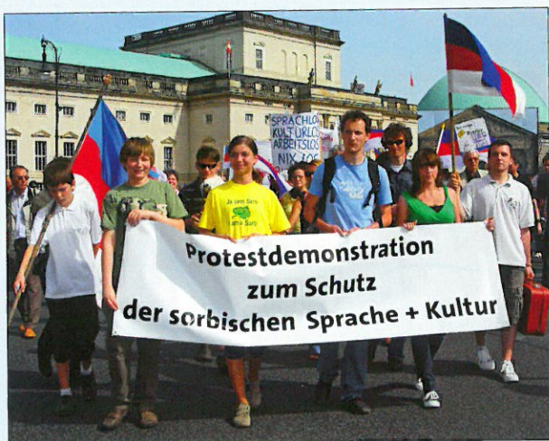
Für eine auskömmliche Finanzierung demonstrierten am 25. Mai 2008 erstmals Sorben in Berlin

Im Zuge der institutionellen Förderung von sorbischer Sprache und Kultur in der DDR baute sie ihre Basis beträchtlich aus. Viele ihrer Mitglieder bekannten sich bewusst als Sorben/Wenden. Um als „Massenorganisation“ anerkannt zu werden, setzte sich die Domowina für den „sozialistischen Aufbau“ ein, was negative Auswirkungen auf die Sprach- und Kulturpflege hatte. Mit der politischen Wende erneuerte sie sich strukturell und inhaltlich. Heute wirkt die Domowina als politisch unabhängiger und selbstständiger Bund Lausitzer Sorben und Dachverband sorbischer Vereine der Ober- und Niederlausitz. Sie fühlt sich verantwortlich für die weitere Zukunft des sorbischen Volkes. Der Bundesvorstand der Domowina wird demokratisch gewählt und repräsentiert alle Schichten und Interessengruppen der Sorben in Sachsen und Brandenburg.